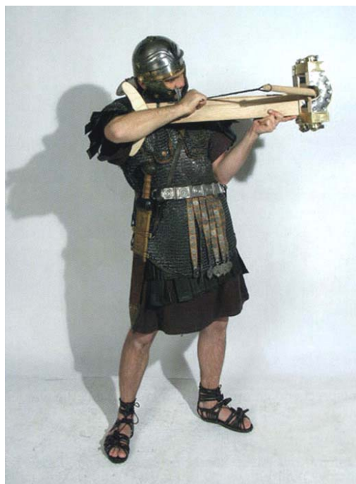
Abb. 4 „Römische ‚Armbrust‘ mit Spannrahmen (Rekonstruktion) im Anschlag.

Waffe überhaupt. Seine geringe Größe - der Rahmen misst über die Querträger einschließlich der Buchsen nur gut 0,26 m , von Seitenständer zu Seitenständer 0,22 m - verbietet es aber wohl, von einem Geschütz zu sprechen. Wir haben hier eher eine Art Torsionsarmbrust vor uns, wie sie - mit anderer Rahmenkonstruktion - insbesondere in der Spätantike unter dem Namen cheiromballistra oder lateinisch manuballista verbreitet war. Antike Torsionsarmbrüste sind seit etwa dreißig Jahren durch verschiedene archäologische Funde von der hellenistischen Zeit bis in die Spätantike nachgewiesen. Unsere Informationen zu Einzelheiten der Konstruktion, insbesondere zum Spannrahmen, waren bislang aber nur sehr unzureichend. Dies gilt vor allem für die Phase vom Hellenismus bis in die frühe Kaiserzeit, aus der noch nicht einmal ihr Name überliefert ist, da kein Schriftsteller dieser Epoche sie erwähnt. Der Xantener Fund stellt daher in dieser Hinsicht unsere Kenntnisse auf eine gänzlich neue Basis. Die Untersuchungen zur Bespannung sind zurzeit noch im Gang. Ein Nachbau, der gerade in Arbeit ist, wird wertvolle Aufschlüsse über die Funktionsweise dieses und anderer Torsionskatapulte liefern.