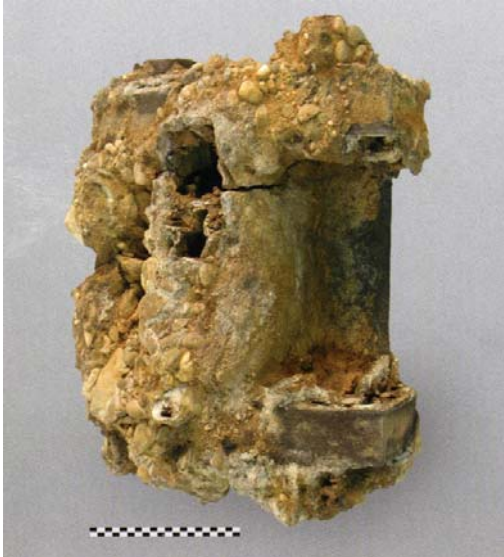
Abb. 1 Xanten/Kreis Wesel Spannrahmen eines römischen Geschützes (Katapult). Zustand bei Auffindung. Mitte 1. Jahrhundert n. Chr.

Die Auskiesung Xanten-Wardt ist dadurch bekannt geworden, daß der Eimerkettenbagger dort seit mehr als anderthalb Jahrzehnten zahllose bedeutende Fundstücke ans Tageslicht befördert hat. Sie stammen überwiegend aus einem römerzeitlichen Altrhein und manches darunter darf mit Fug und Recht als einzigartig bezeichnet werden - der versilberte Reiterhelm etwa, der sich heute im Bonner Landesmuseum befindet, oder Bronzegefäße mit bis dahin unbekanntem Formdetails. Umso erstaunlicher ist, daß diese Fundstelle vereinzelt immer noch vollkommen Überraschendes, ja Sensationelles bereithält. Zum Ende des Jahres 2000 gelangte ein wenig ansehnliches, über und über mit Sand und Kies verkrustetes, kastenförmiges Objekt aus der Auskiesung ins Regio-