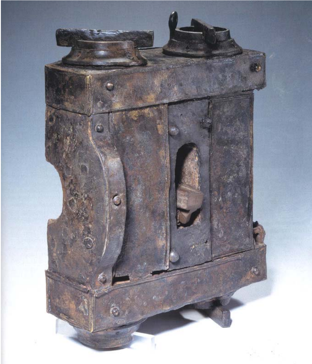
Abb. 2 Xanten / Kreis Wesel. Spannrahmen eines römischen Geschützes (Katapult). Zustand nach der Restaurierung Mittel. Jahrhundert n. Chr.